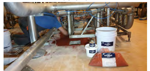
Aplikacja kompozytu Belzona 4181