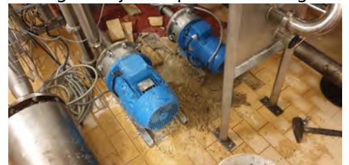
Usunięcie płytek oraz zniszczonego betonu