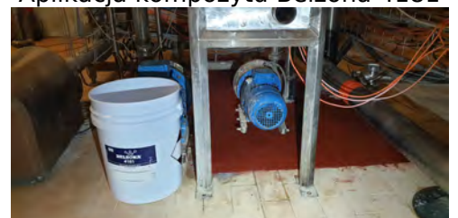
Aplikacja kompozytu Belzona 4181