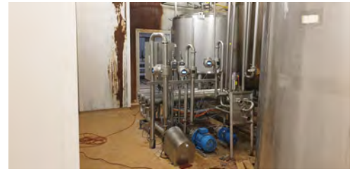
Uszkodzona wykładzina chemoodporna posadzki