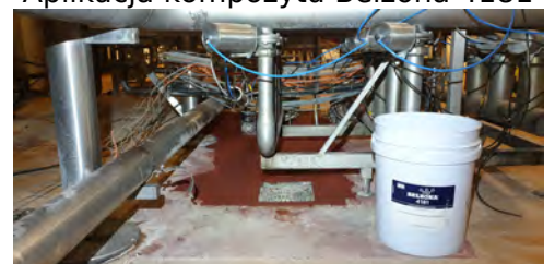
Aplikacja kompozytu Belzona 4181